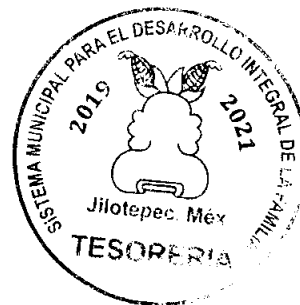
G.P. CLAUDIA ARCOS NONATO TESORERA SISTEMA MUNICIPAL DIF DE JILOTEPEC

Cuentas de Egresos: EL SALDO DE LOS EGRESOS PRESUPUESTARIOS Y CONTABLES ES DE $ 1,171,494.65